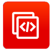
增强型 AT 命令集