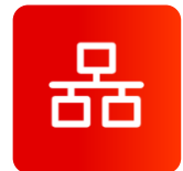
内嵌多种网络 协议栈